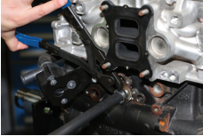
Hose Clip Pliers - for Single/Double Ear Clips | 8261